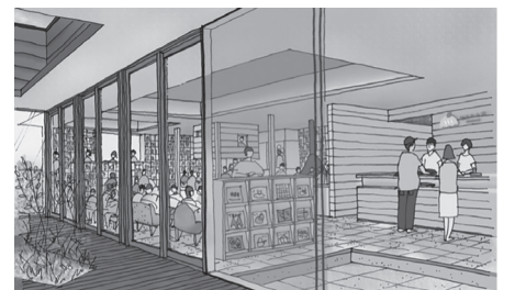
サウナを中心に新提案を図る「おふる café かりんの湯」完成予想パース