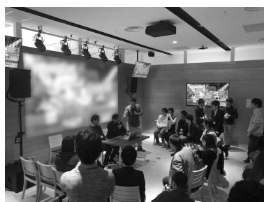
[価格.com GG Shibuya mobile esports cafe&bar]でのイベント風景