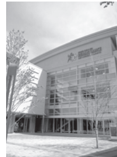
詳しい会場地図は参加費にてご案内いたします。