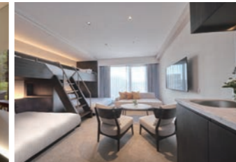
霞ヶ関キャピタルの最新ホテル「FAV HOTEL 飛騨高山EAST」