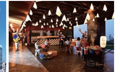
星野リゾート・リート投資法人が保有する「界 別府」