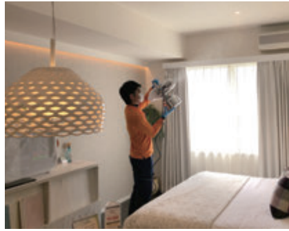
ウイルスは風などで舞い上がり拡散するので、天井部にも安定型次亜塩素酸ナトリウムを噴霧