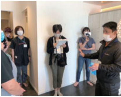
ウイルスの除菌作業を行なう友心がグループホテルの店長や清掃スタッフへ清掃・指導を実施