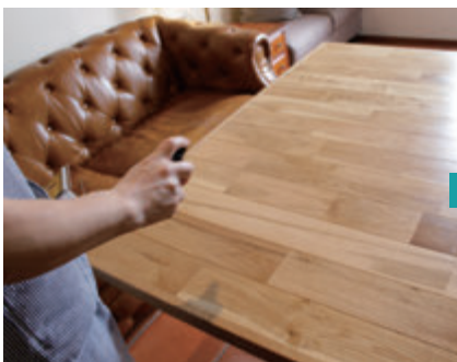
清掃スタッフはミニボトルに入った安定型次亜塩素酸ナトリウムを噴霧