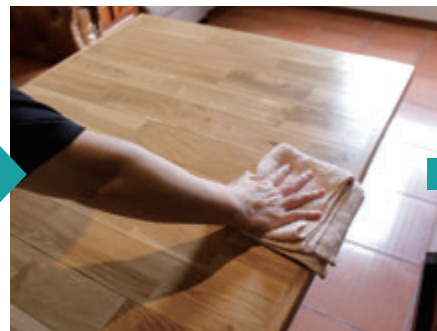
除菌清掃のポイント、一方向に一回だけ拭き取ること。同じタオルで2度拭きすると拭き取ったウイルスは再びテーブルに付着してしまう