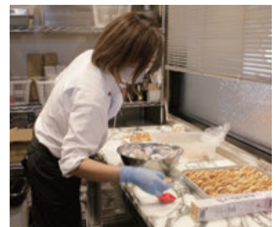
厨房では衛生管理を徹底し、スイーツを手づくりで行なっている