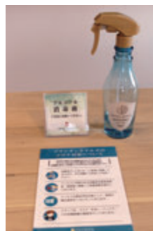
各客室にはアルコール消毒液を設置。ホテルのコロナ対策を明記して告知している