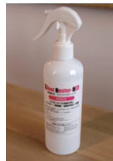
[サイレントバスターレッド] プランタンホテルグループで使用する安定型次亜塩素酸ナトリウム。弱アルカリ性で人体への影響もなく、細菌やウイルスを瞬時に不活性化させる。客室、共用部、バックヤードで使用