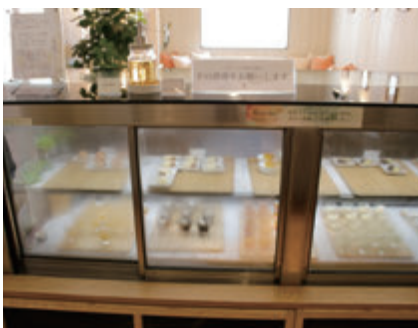
HOTEL & SWEETS FUKUOKAで人気のスイーツbuffet。スタッフ手作りのスイーツがショーケースに並び、利用者に手の消毒を告知する