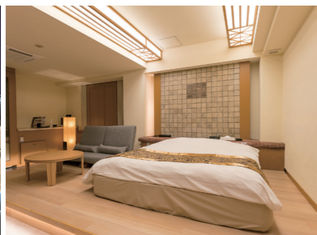
今年6月16日のリニューアルオープンに合わせて、「UKAI」システムを全室に導入した「ホテル アールプラス日高」。さらなる集客アップを目指す