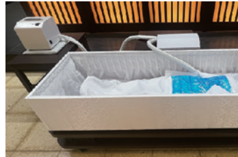
棺内で使用した場合