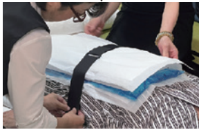
「Eco Protect」 使用の流れ