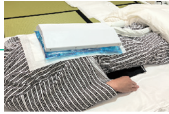
布団の上で使用した場合