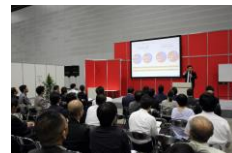
※画像は過去開催の風景です

／ 「デジタル終活」Facebook グループオンラインミーティング / コロナ禍での適正な製品選びの衛生講習会