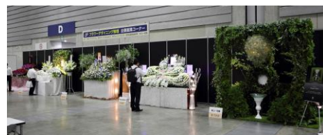
※画像は過去開催の風景です

協力企業：(株)フォーシーズンズ／(株)ナイン／(株)ユ一花園（※公開セミナーも担当）／(有)和光造花製作所