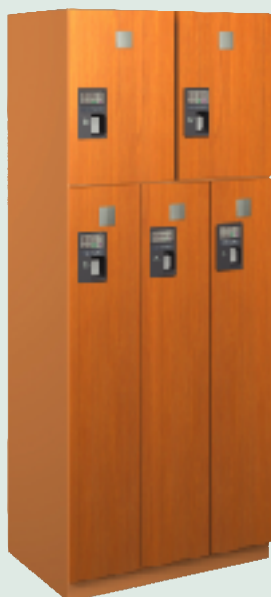
スペース効率の高い「フリースタイルロッカー」