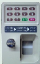
カード錠とテンキーを併用しセキュリティ性を高めた「テンキーダブルロック」

防犯性を高めた「テンキーダブルロック」を開発し、2007年1月より市場に投入している。防犯性を強化することは利用者の信頼