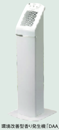
環境改善型香り発生機「DAA」