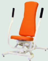
写真2:女性専用スタジオにふさわしい、曲線的で丸みをもたせたデザインオリジナルマシン。日本製なのでメンテナンスも安心