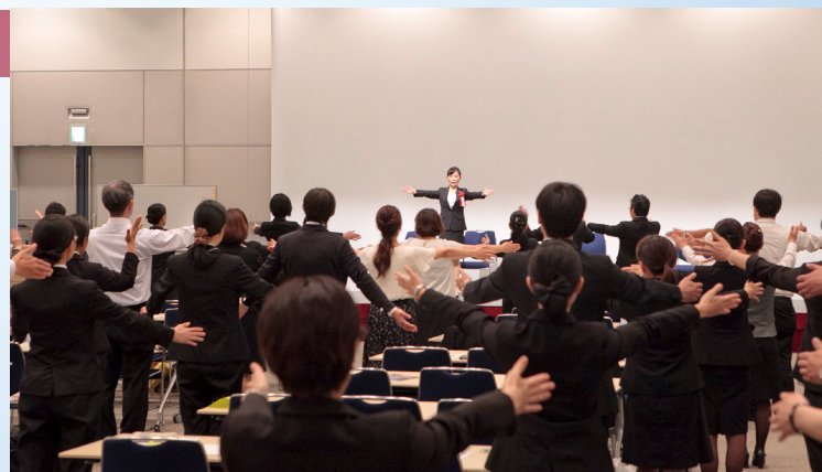
弊社主催のセミナー・シンポジウムで、受講者数延べ300人超の人気講座を映像で学ぶ「接遇スキルアップ」の基礎習得の決定版!!